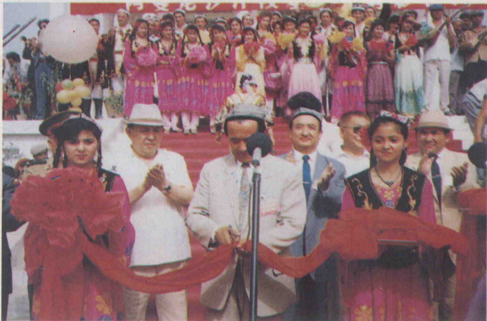
رەئىس تۆمۈر داۋامەت لېنتا كەسمەكتە