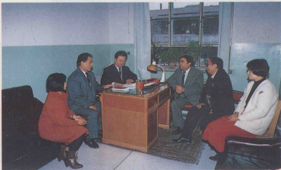
شىنجاڭ خەلق نەشرىياتىدىكى مۇھەررىرلەر «ئۇيغۇر ئون ئىككى مۇقامى ھەققىدە» دېگەن كىتاب ئۈستىدە سۆھبەتلەشكەن