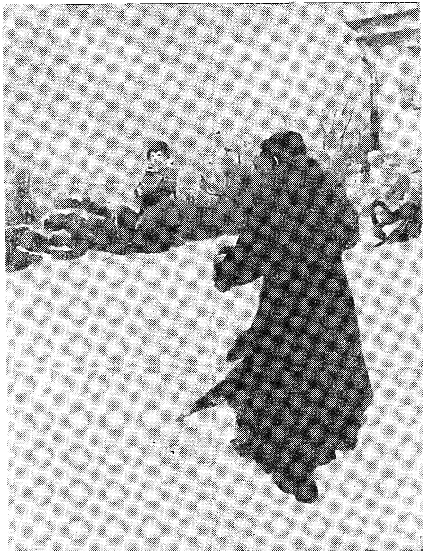
بۇ قىياپىتى قورقۇنچۇلۇق بۇ ساقاللىق ئادەمنىڭ ئۆز ئاتىسى ئىكەن لىكىنى نۇتودى. (836 - بەتكە)