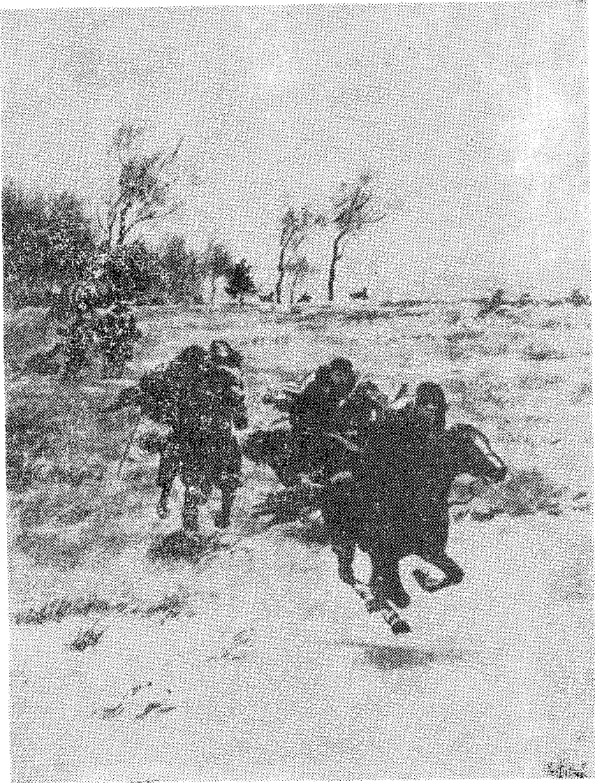
تۆت كۈن جەرياندا، بۇ باندىلار جەڭگە كىرىشەستىن توشقاۋىسىز شەرققە قاراپ كېتىۋەردى. (734 - بەتتە)