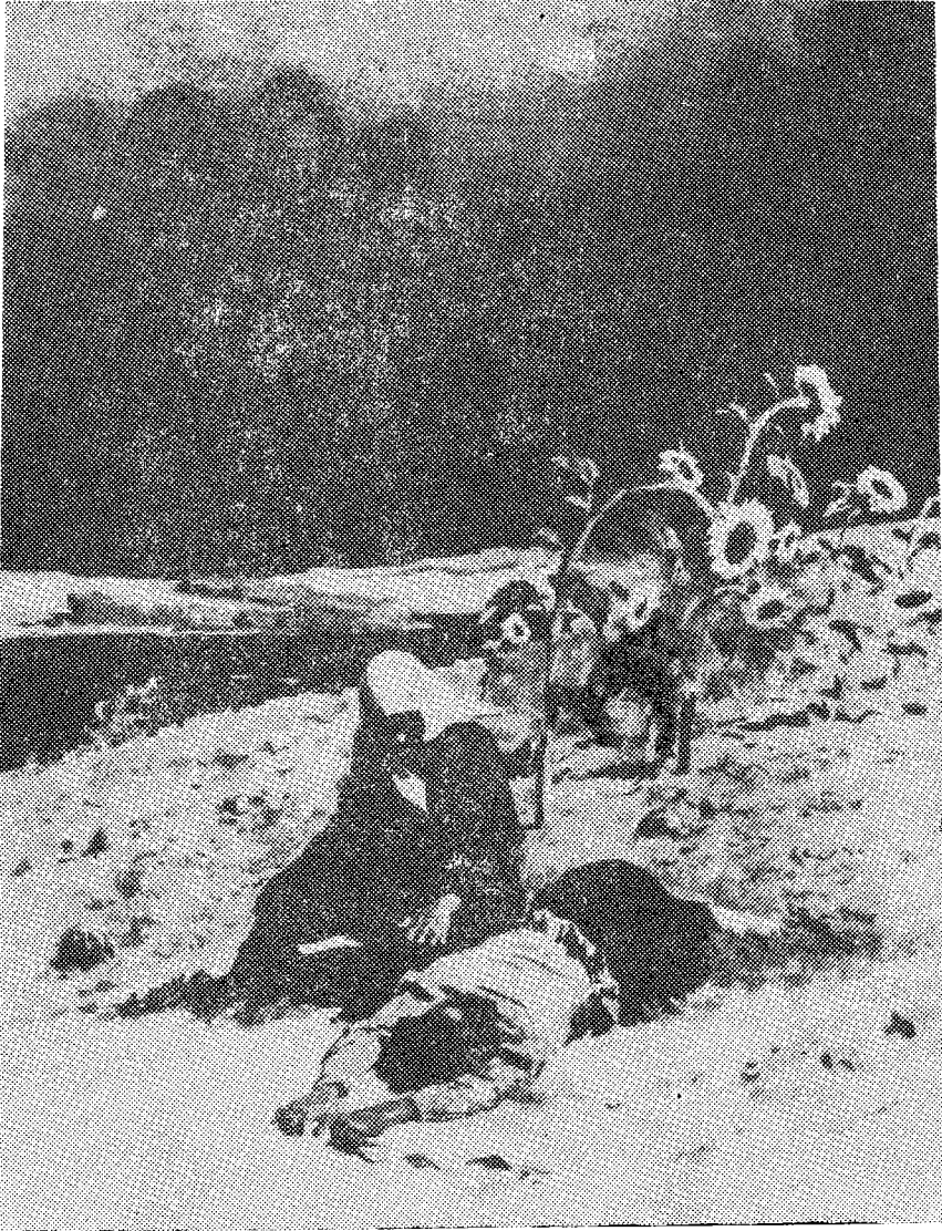
ئۇ يېقىمىسىز قۇرغاق يەرگە يۈزۈچە يىقىلدى - دە، كۆكرىكىنى يەرگە يېقىپ، ياش تۆكەستىن نالە - زار قىلمىشقا باشلىدى. (258 - بەتكە)