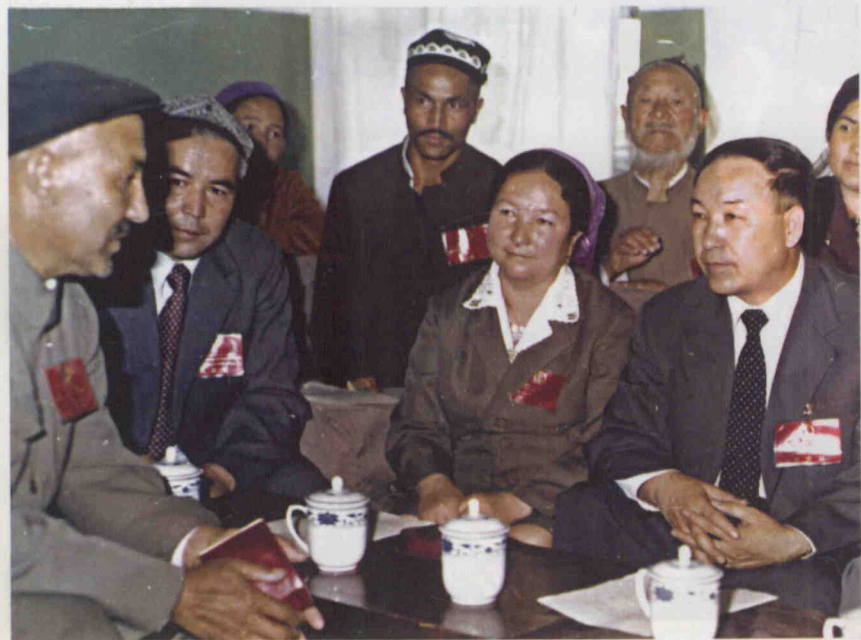
قىسمەن قۇرۇلتاي ۋەكىللىرى بىلەن سۆھبەتتە