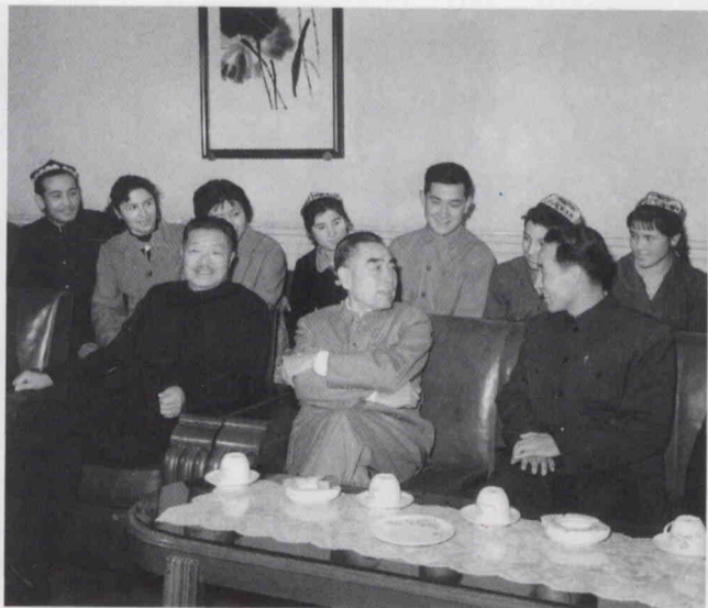
جۇئېنلەي زۇڭلى، مارشال خې لوڭنىڭ ئىسمايىل ئەھمەد قاتارلىق شىنجاڭ ۋەكىللىرىنى قوبۇل قىلغان ۋاقتى.