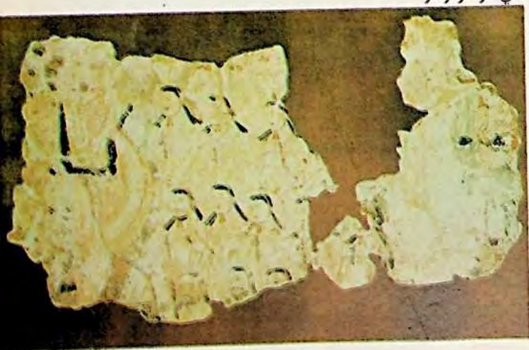
- رەسىم :

بۇ خۇن ئۇيغۇر خانلىرىدىن گۇ خاقانىنىڭ مانى دىنىغا ئىنقاد قىلغان ۋاقتىدىكى كۆرۈۈشىنىڭ تەسۋىرىي سۈرىتى