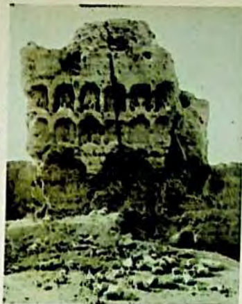
10 - رەسىم : يارغول قەدىمكى شەھىرىدىكى بۇددا ئىبادەت خانا ، مۇنار خارابىلىرىدىن كۆرۈنۈشلەر