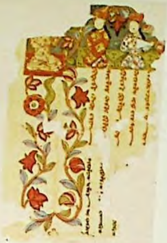
6 - رەسىم : ئىدىقۇت ئۇيغۇرلىرىدىن ئىستورىيە دىنىغا ئېتىقاد قىلغان بىر قىسىم ئۇيغۇر لارنىڭ تەسۋىرىي سۈرىتى