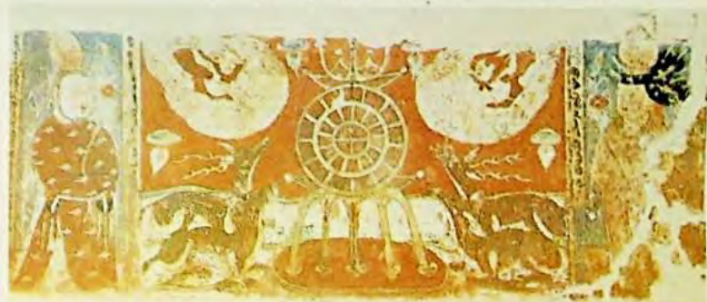
11 - رەسىم : بۇددا مەزمۇنىدىكى تام رەسىملىرىدىن نەمۇنىلەر