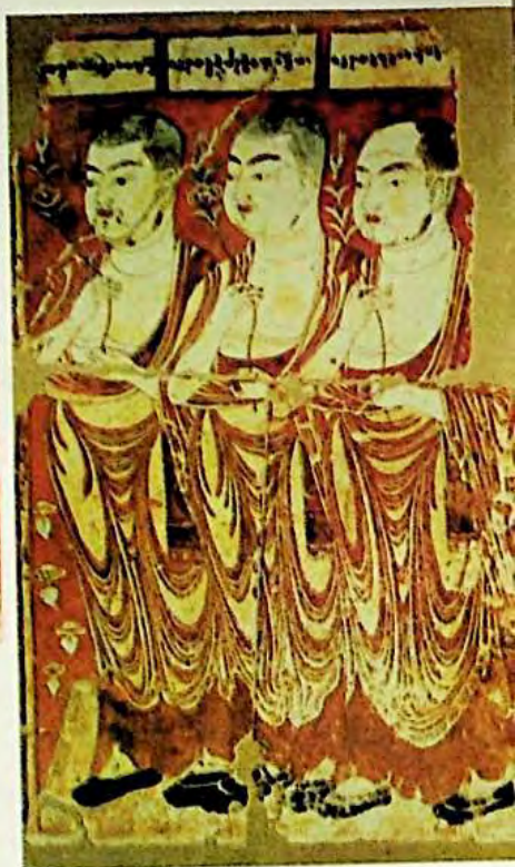
3 - رەسىم :

ئىدىقۇت دەۋرىدىكى يۇقىرى قاتلام كىشىلىرىنىڭ تەسۋىرىي سۈرىتى ( چوڭايتىلمدۇ )