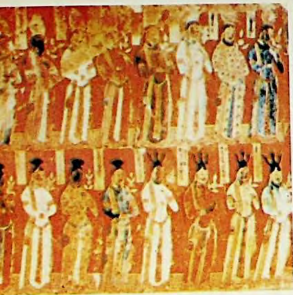
4 - رەسىم :

ئىدىقۇت دەۋرىدىكى يۇقىرى قاتلام كىشىلىرىنىڭ تەسۋىرىي سۈرىتى ( چوڭايتىلمدۇ )