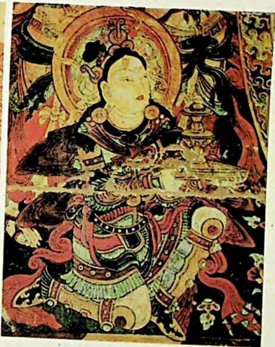
1 - رەسىم : بۇددا دىنىغا ئائىت تام سۈرەتلىرى