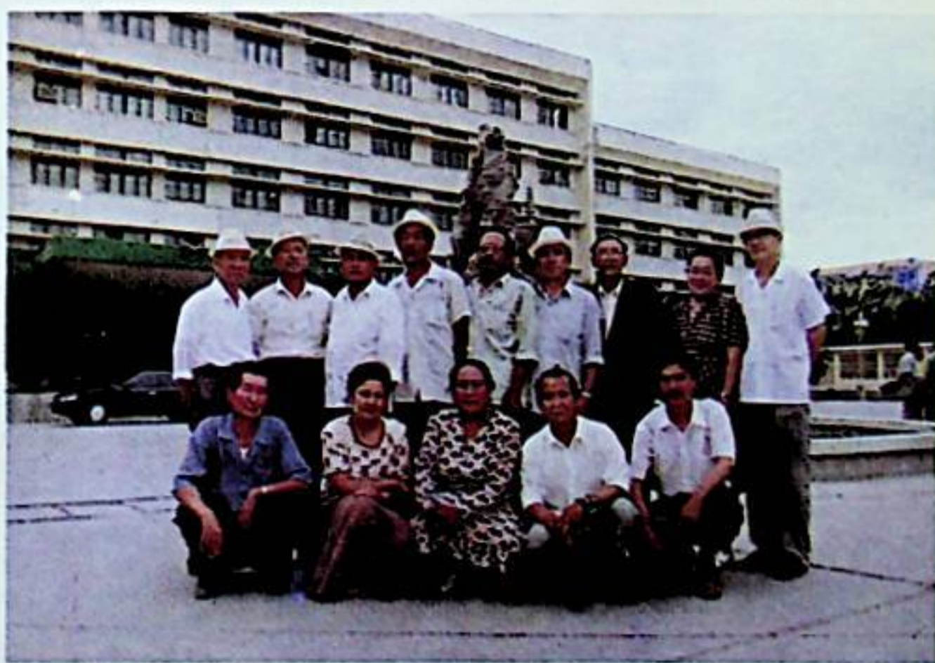
قۇمۇل شېۋىسى ئوغرىسىدا پىكىر ئېلىش يىغىنىغا قاتنىشقان قۇمۇل زىيالىلىرى