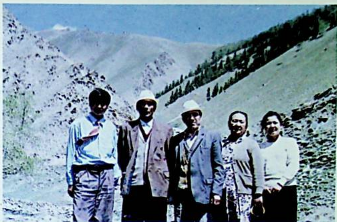
قۇمۇل شېۋىسىنى تەكشۈرۈش خادىملىرى ئۆمۈرتىدە