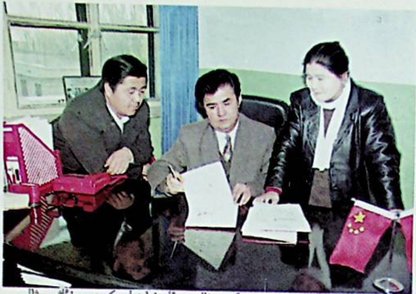
قۇمۇل ۋىلايەتلىك مەمۇرىي مەھكىمە ۋالىسى ئابدۇراخمان كېرەم، مۇئاۋىن ۋالى توختىخان ئىسمائىل ۋە مۇئاۋىن باش كاتىپى تۇردى ئابلا قۇمۇل شېۋىسى ماتېرىياللىرىنى كۆرۈش ئۈستىدە.