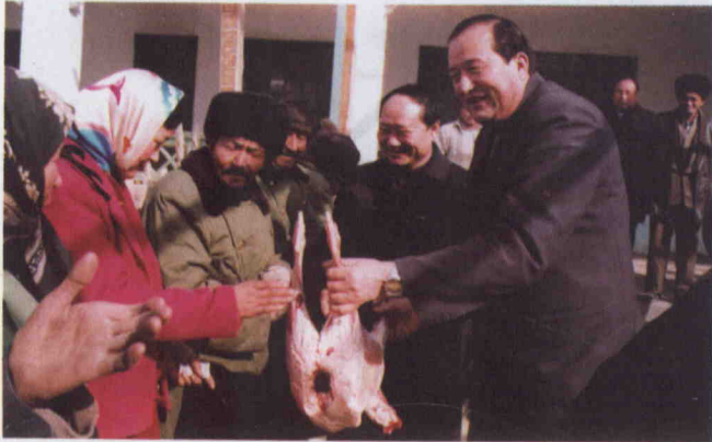
ئابدۇراخمان قۇربان قۇربان ھېيتتا ئاممىغا گۆش تارقىتىشقا