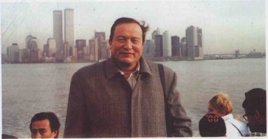
2000 - يىلى 12 - ئايدا ئابدۇراخمان قۇربان جۇڭگو ۋەكىللەر ئۆمىكى تەركىپىدە كانادانىڭ ۋانكۇۋېر، ئوتتاۋا، كۇبېك، تورونتو شەھەرلىرىدە، ئامېرىكىنىڭ نيۇ - يورك، فىلادېلفىيە، ۋاشىنگتون، كالىفورنىيە قاتارلىق جايلارىدا زىيارەتتە بولدى