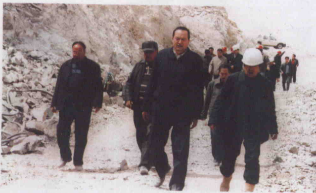
ئابدۇراخمان قۇربان كېرىيە ناھىيەسىدە قۇرۇلۇۋاتقان «بەخت ئاتا» سۇ ئامبىرى قۇرۇلۇشىغا يېتەكچىلىك قىلماقتا