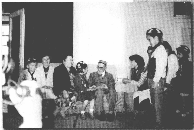
ئۆسمۈرلەر بىلەن بىللە