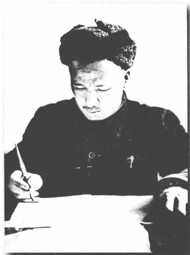
«تۈركىي تىللار دىۋانى» نى تەرجىمە قىلماقتا .