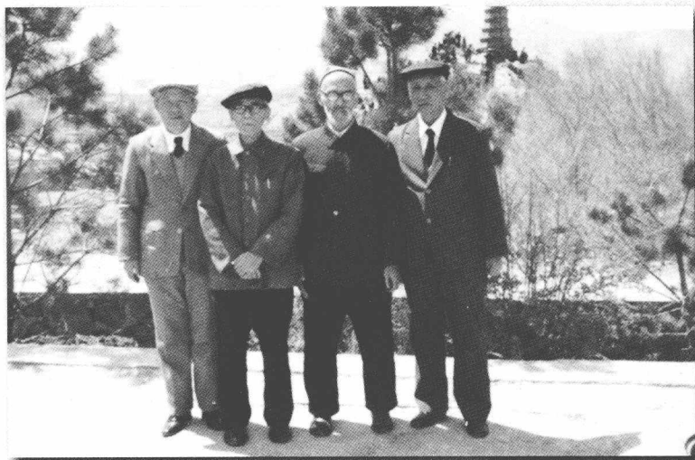
ئۈرۈمچى قىزىلتاغدا ئالىملار بىلەن بىللە (1987-يىلى 5-ئاي)