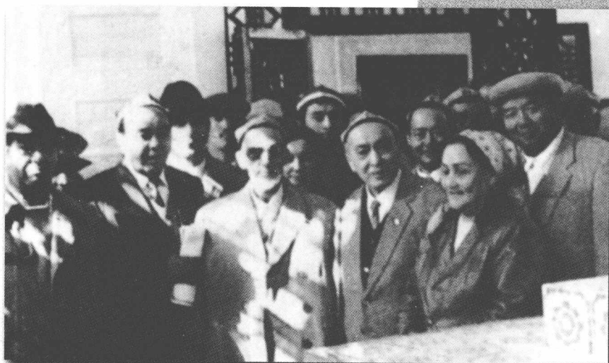
1989-يىلى 10-ئاينىڭ 15-كۈنى قەشقەردە ئېچىلغان 2-نۆۋەتلىك مەملىكەتلىك «قۇتادغۇبىلىك» ئىلمىي مۇھاكىمە يىغىنى مەزگىلىدە ئالىملار بىلەن مەھمۇد قەشقىرى قەبرىسىدە.