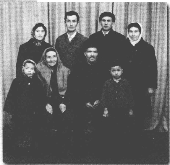
ئائىلىسىدىكىلەر بىلەن بىللە