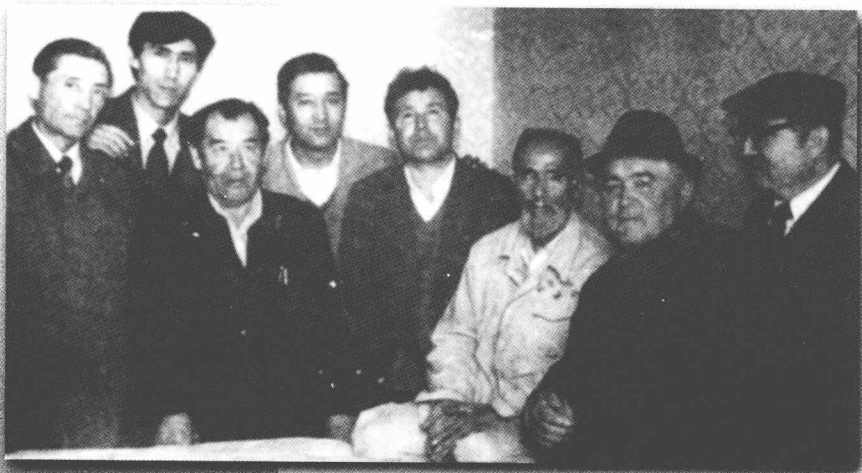
باش قەلەمكەشلەر بىلەن بىللە.