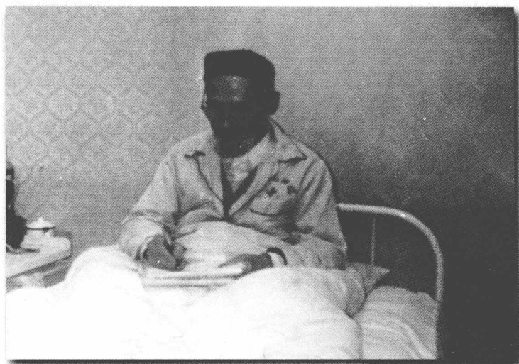
«تۆت قېتىم ئۆلۈپ بەش قېتىم تىرىلگەن ئادەم» رومانى ئىجادىيىتى ئۈستىدە (1989- يىلى)