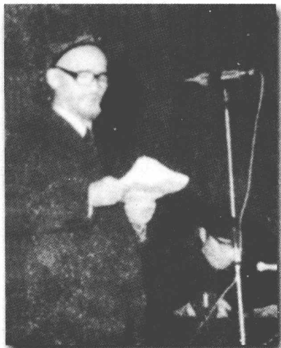
كىلاسسىك ئەدەبىيات ئىلمىي مۇھاكىمە يىغىنىدا (1985-يىلى)